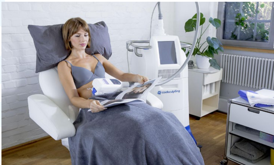
CoolSculpting® behandelt Fett mit Kälte, ganz ohne operativen Eingriff.

CoolSculpting® ist ein geprüftes und patentiertes Verfahren zur Fettbehandlung ohne OP, das bereits seit 12 Jahren auf dem Markt ist. In dieser Zeit wurden weltweit mehr als 11 Millionen Behandlungen durchgeführt. Es gibt mehr als 70 von Experten begutachtete klinische Veröffentlichungen. CoolSculpting® ist von der amerikanischen Food and Drug Administration (FDA) zugelassen und CE-zertifiziert. Die FDA ist die Lebensmittelüberwachungs- und Arzneimittelbehörde der Vereinigten Staaten, die CE-Kennzeichnung besagt, dass ein Produkt die Anforderungen aller gültigen EU-Richtlinien erfüllt.